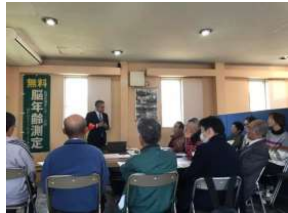
⑤ 11月4日(月) 14:00~16:00 つしま夢まちづくりセンター 「つし丸ビュッフェ出展説明会」

※3月20日開催予定の市民活動フェスタ「つし丸ビュッフェ」は新型コロナウイルス感染症により中止となりました。