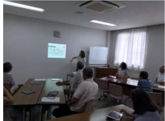
④ 4月7日(日) 10:30~11:30 パソコン教室オズ 一宮玉野教室 「家族で考えよう! 相続の基本と対策セミナー」